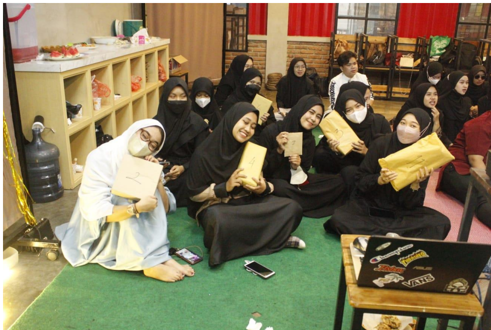
Dokumentasi kegiatan saat tukar kado