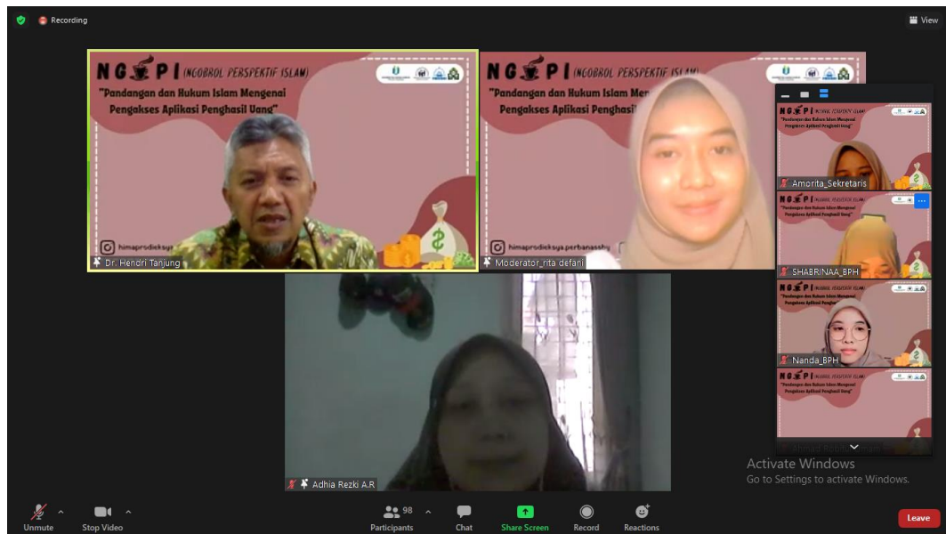
Dokumentasi kegiatan saat sesi tanya jawab