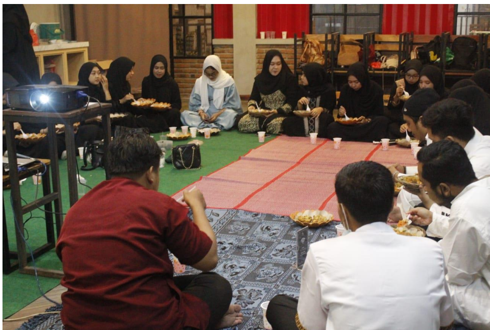
Dokumentasi kegiatan saat buka bersama