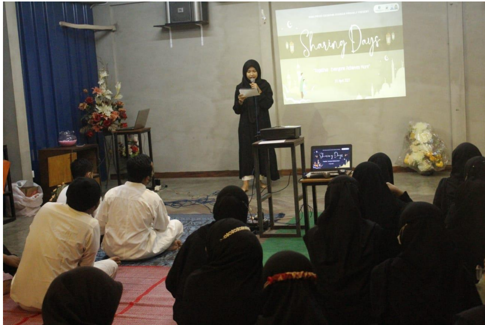
Dokumentasi kegiatan saat pembukaan acara Sharing Days oleh MC