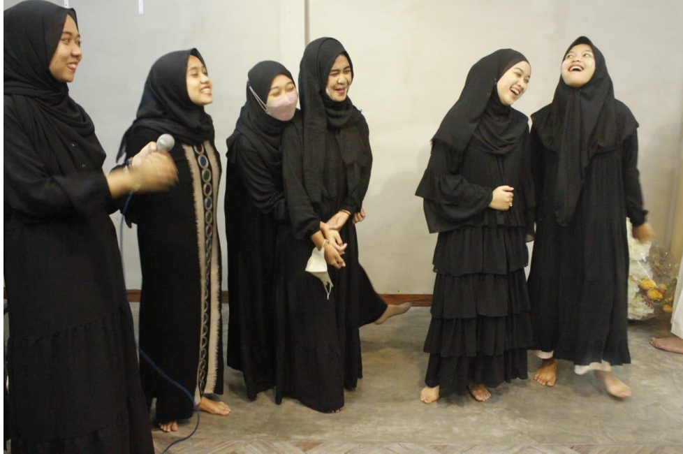
Dokumentasi kegiatan saat Games