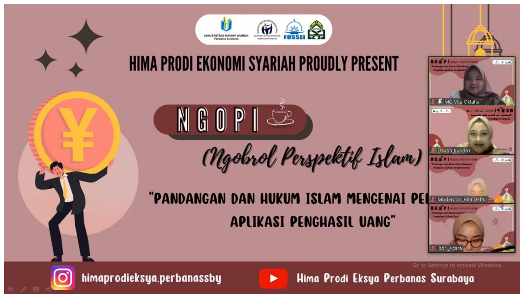
Dokumentasi kegiatan saat pembukaan acara NGOPI oleh MC